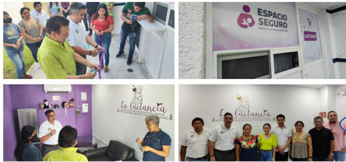
Inauguración de Lactario