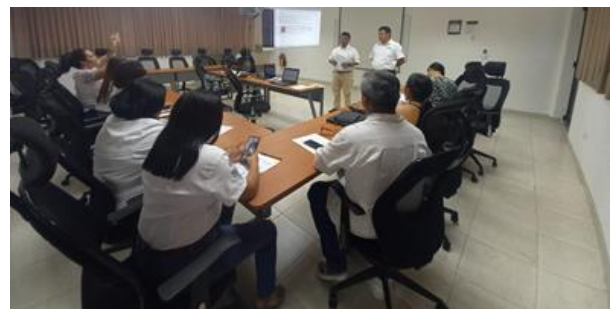
Primera sesión Ordinaria del Subcomité